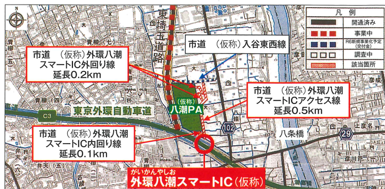
外環八潮スマートIC(仮称)地図