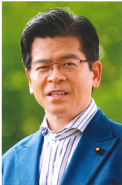
党幹事長、同政治改革本部長、同埼玉県本部顧問。元国土交通相、同財務副大臣。党政務調査会長、同青年局長などを歴任。旧建設省道路局課長補佐を経て衆院当選10回。東京大学工学部卒。東京都豊島区生まれ。66歳。

私自身、現場をまわる中で、こうした中小企業の皆さまを応援していくことが地域活性の鍵であると強く実感しています。