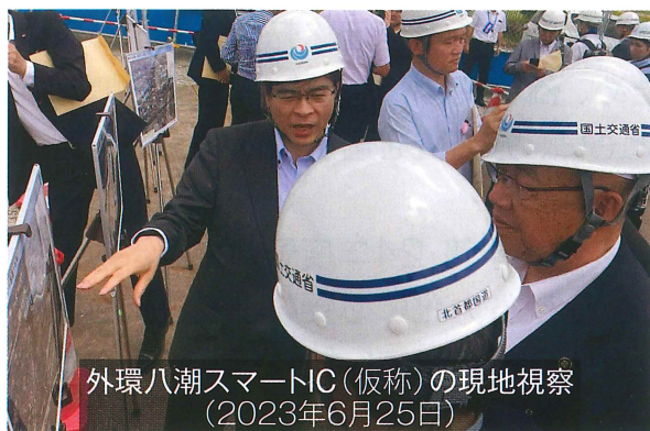
外環八潮スマートIC(仮称)の現地視察 (2023年6月25日)

東埼玉道路・外環八潮スマートインターチェンジ(IC、仮称)の整備へ、また一步前進しました。